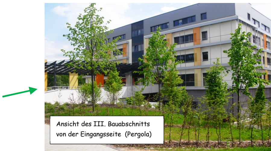
Ansicht des III. Bauabschnitts von der Eingangsseite (Pergola)